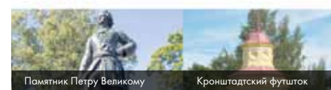
Памятник Петру Великому

Муниципальное Образование город Кронштадт