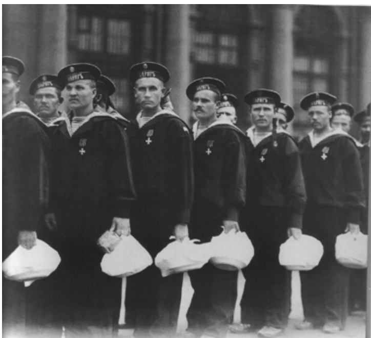
Матросы крейсера «Варяг» после торжественного обеда в Зимнем дворце (фрагмент).

Летом 1904 года, после того как овации морякам наконец-то стихли, Михаил осел в Кронштадте. Интересно, что корабельный священник, прославленный на всю империю, никакой духовной карьеры не сделал. Служил