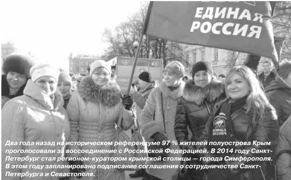
Два года назад на историческом референдуме 97 % жителей полуострова Крым проголосовали за воссоединение с Российской Федерацией. В 2014 году Санкт-Петербург стал регионом-куратором крымской столицы — города Симферополя. В этом году запланировано подписание соглашения о сотрудничестве Санкт-Петербурга и Севастополя.