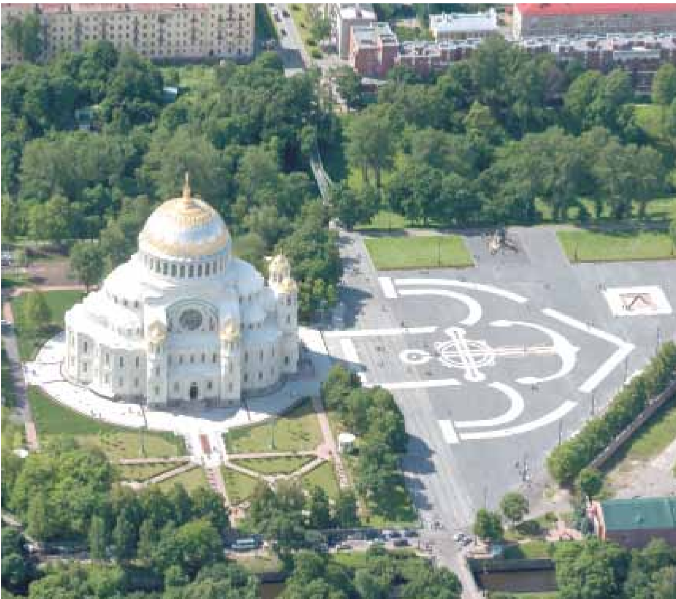
Фото: Владимир Демин