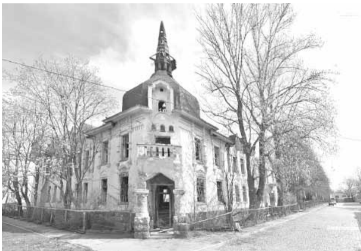
Интересен не только дом, но и само место, помнящее выдающихся российских военачальников братьев Лазаревых — Андрея, Михаила и Алексея. О них в Кронштадте напоминает Лазаревский переулок, что соединяет улицы Пролетарскую и Мануильского и проходит вдоль всей усадьбы Лазаревых. Ранее переулок назывался Церковным, но был переименован властями Кронштадта. Протяженность переулка всего 130 метров, но сейчас это самая длинная булыжная мостовая в Санкт-Петербурге.

Впрочем, эта мемориальная доска, установленная по решению Ленгорисполкома в 1954 году, не спасла от страшного запустения столь памятное историческое место. Ныне