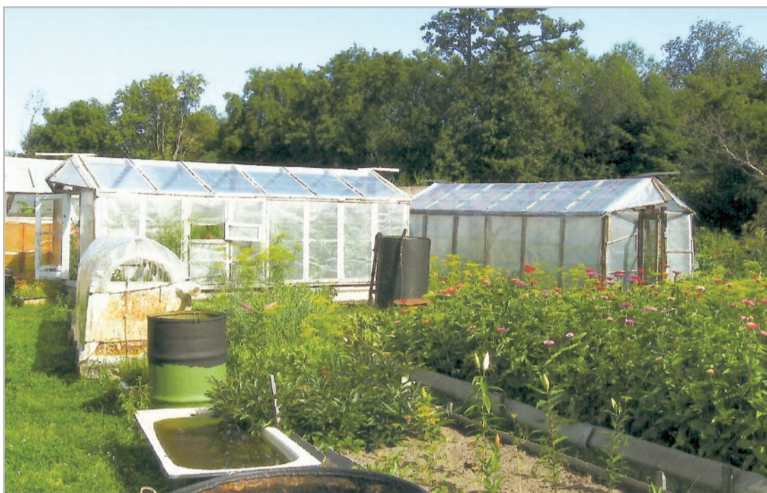
Все эти тыквы, баклажаны, помидоры, перцы, дыни Любовь Георгиевна Кузнецова (на фото сверху) вырастила в теплицах и парниках на двух сотках своего огорода