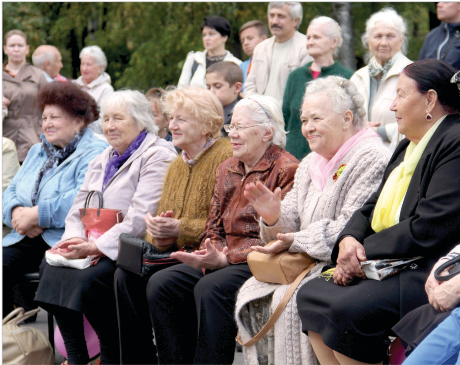
Гости не скупилась на улыбки и аплодисменты