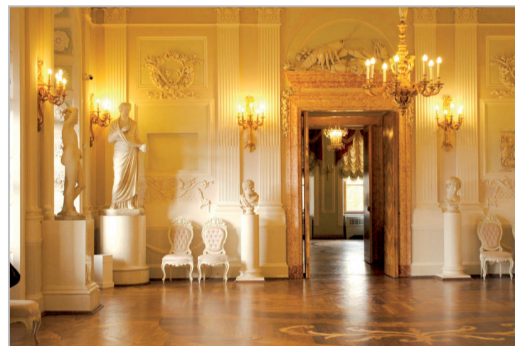
Золото Гатчинского дворца

– Я пишу про Павла I книгу, поэтому мне было важно побывать в Гатчине. Получил отличные впечатления и новые знания, которые мне помогут в моей работе. Дворец прекрасен! Больше всего поразили тронный зал и парадная опочивальня императора.