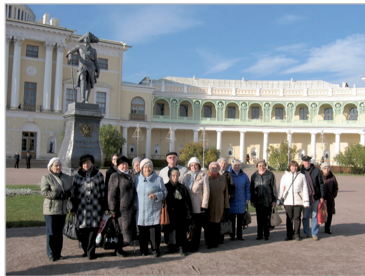
Перед дворцом в Павловске