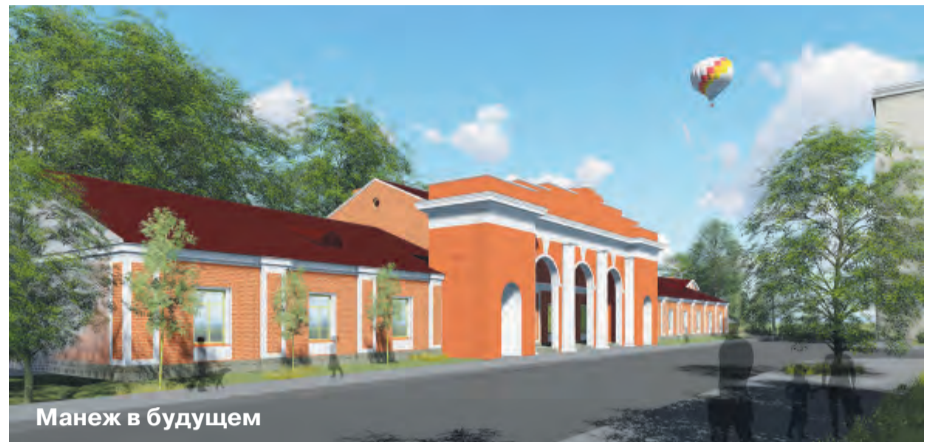
Манеж в будущем

В Музее истории Кронштадта состоялись общественные слушания по поводу использования объекта культурного наследия — Сухопутного манежа, бывшего Спортивного клуба флота.