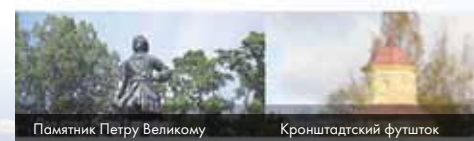
Памятник Петру Великому

Муниципальное Образование город Кронштадт