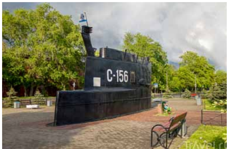
Мемориал Морякам-подводникам Балтики в Кронштадте на Флотской ул. Рубка ПЛ «С-156».

Мирового океана. Десятки моряков части после войны удостоились государственных наград. На базе соединения формировались отряды кораблей, выполняющих сложные и секретные задачи, о которых пока нет возможности рассказывать широкой публике... Реалии же последних десятилетий вновь сделали ее единственной на Балтике. Увы, количество подводных кораблей на Балтике сейчас можно пересчитать по пальцам одной руки. И все же — за погружением следует всплытие! На 99-м году образования соединения моряки части подводников выполнили десятки учебно-боевых задач в море. Именно в этой старейшей части подводников России проводятся мероприятия по подготовке экипажей новейших субмарин 636.3 проекта.