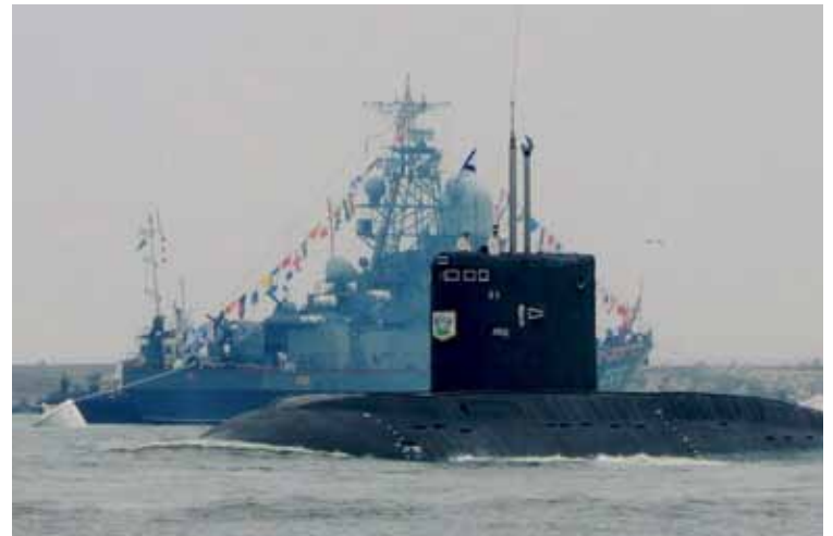
Современная дизель-электрическая подлодка на параде в честь Дня ВМФ