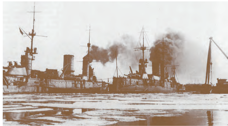
Мятежные линкоры в Кронштадте

ми кораблями, прибывшими для участия в штурме Зимнего дворца, 25 октября прибыла и яхта «Зарница», имевшая на борту отряд из 50 человек — курсантов фельдшерской школы, врачей и медсестер госпиталя. Отряд оказывал помощь раненым и одновременно принимал участие в штурме Зимнего. 25 октября государственная власть перешла в руки