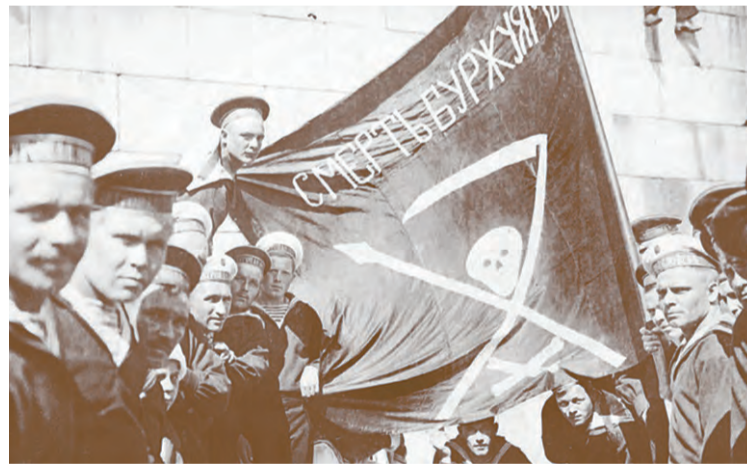
Кронштадт. Антиправительственное выступление 1921 года

казал госпиталям быть готовыми к массовому приему раненых. В КВМГ была усилена дежурная служба, запрещены отпуска сотрудников и организовано получение дополнительного медицинского имущества.