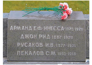
Надгробная плита у Кремлевской стены

При ликвидации мятежа была проведена большая работа по сбору раненых,