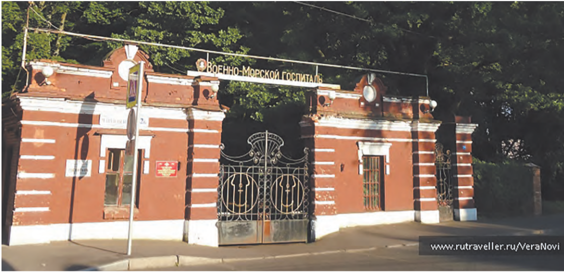
Кронштадтский военно-морской госпиталь сегодня

Революционные события 1917 года всколыхнули массы петербургских рабочих и матросов Кронштадта. Благодаря самоотверженному труду врачей, сестер милосердия и санитаров Кронштадтского военно-морского госпиталя всем пациентам в эти грозные дни была оказана необходимая медицинская помощь.