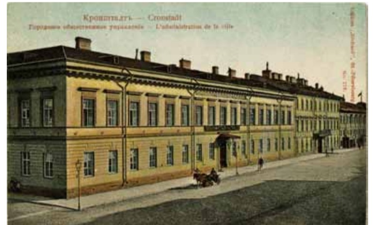
Городское общественное управление. 1890-1900 гг. Кронштадт

В нашем Кронштадте с 70-х годов позапрошлого века и до революции 1917 года также работало местное самоуправление — Городская дума. Депутаты Думы избирались на конкурентной основе. Сами они выбирали наделенного большими полномочиями городского голову. Более 10 лет, в 1870-80-х годах, эту должность занимал кронштадтский предприни-