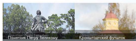
Памятник Петру Великому

Муниципальное Образование город Кронштадт