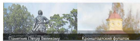
Памятник Петру Великому

Муниципальное Образование город Кронштадт