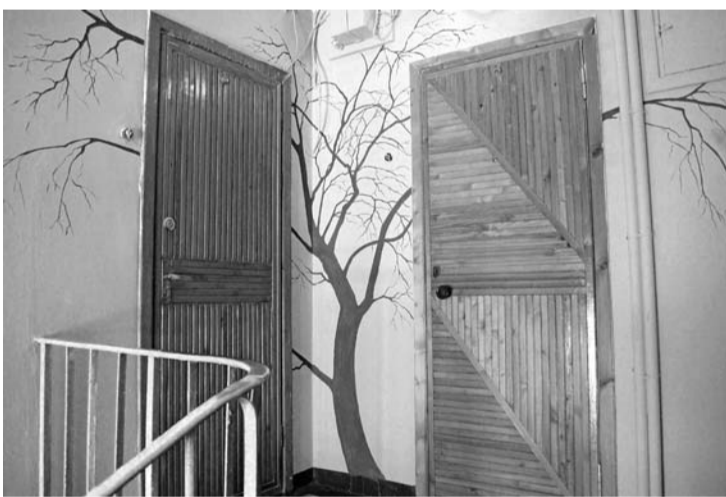
Подъезд стал как живой

На улице лето. Но есть дома, где лето — независимо от погоды за окном. Корреспондент «КВМ» заглянул по двум адресам, где цветы в подъездах радуют глаз круглый год. Потому что они нарисованные. И появились на стенах благодаря инициативе жителей.