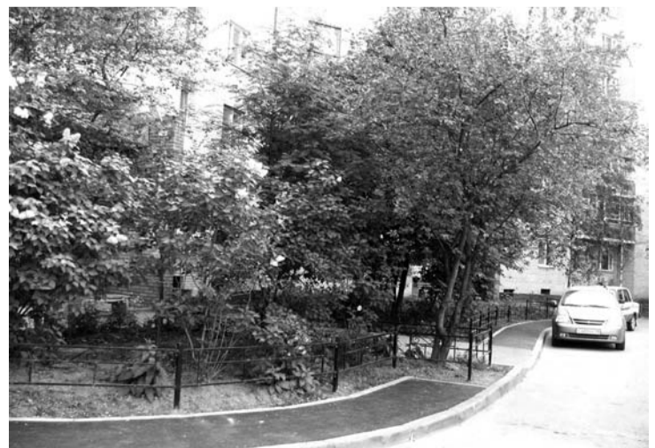
На пути вишнёвое дерево, и чтобы его обойти, надо спуститься на дорогу, на которой зачастую стоят автомобили

городу, поэтому ухаживать за ним должно ООО «Озеленитель». Тротуары и ограждение газонов построили настолько, насколько позволили денежные средства. Металлодекор устанавливали по остаточному принципу, рассчитав метраж под деньгами. В этом году муниципалам передали уборку дорог местного значения, а средства на эти цели не предусматривали - бюджет был уже свёрстан, поэтому вся наша экономия идёт не на выполнение пожеланий жителей, а на дороге. Что касается вазонов с цветами - в нашем ведении их более двухсот. Мы меняем цветы два раза за сезон и даже готовим под зиму. По адресу Цитадельское шоссе, 45/2 числится всего два вазона. С анютинскими глазками как раз наши. Пустые вазоны в форме гайки в 19-м квартале принадлежат другой организации, может быть, жилищникам. Системы в вопросе благоустройства территорий пока нет. В прошлом году, например, мы получили замечание от Счётной палаты за то, что косили не свою траву. Нынешним летом обкашивать будем только незакреплённые территории.