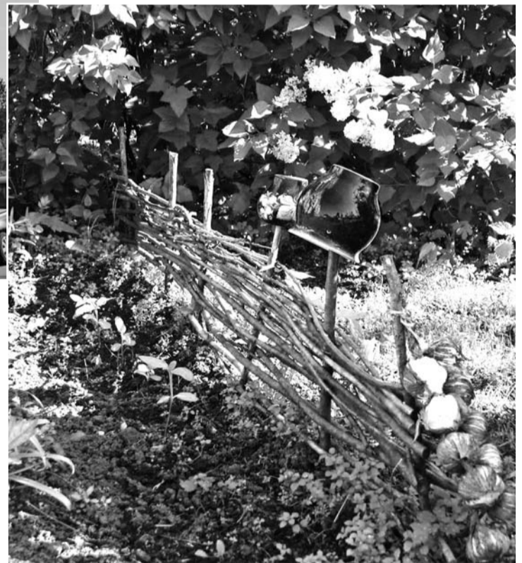
В сияющей глазури глиняного горшка отражается небо и газон напротив