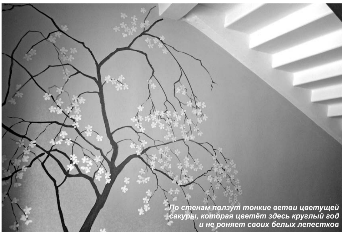
По стенам ползут тонкие ветви цветущей сакуры, которая цветёт здесь круглый год и не роняет своих белых лепестков