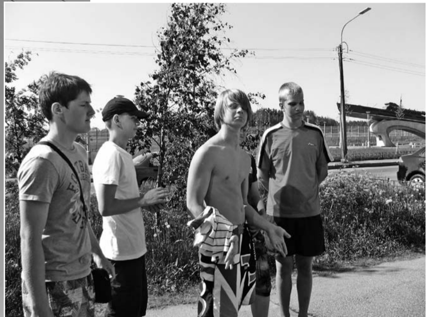
Никто не удержит мальчишек в жару в каменных джунглях - они идут на юго-запад, преодолевая насыпь и КАД