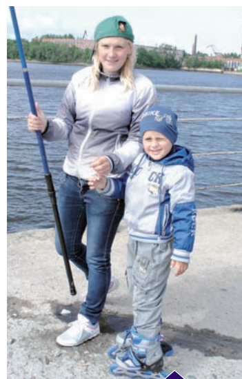
Пока младший спит в коляске (за кадром) мама учит удить рыбу старшего

- К тому, что старший сын увлёкся рыбалкой, я отношусь