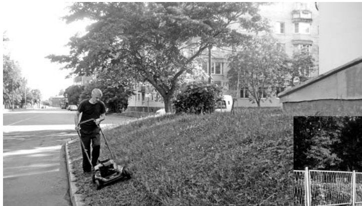
На перекрёстке Посадской и Владимирской разбиты газоны и заасфальтирована «народная тропа»